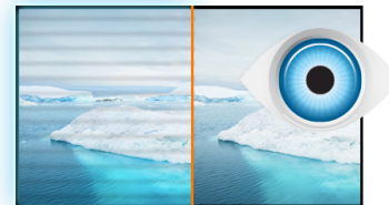
FLICKER-FREE + BLUE LIGHT Technologie

Die VA Panel Technologie bietet einen hohen Kontrast und gute Farbbrillanz bei einem viel größeren Einblickwinkel als bei der standard TN-Panel Technologie.